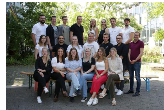
Die Studierenden der Fachschule Oberstufe Schuljahr 2022 / 23

Geblockter Präsenzunterricht in 12 Wochen à 60 Stunden.