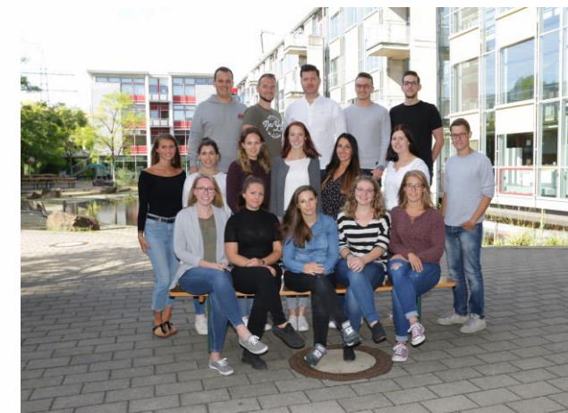
Die Studierenden der Fachschule / Oberstufe

Geblockter Präsenzunterricht in 12 Modulen à 1 Woche.