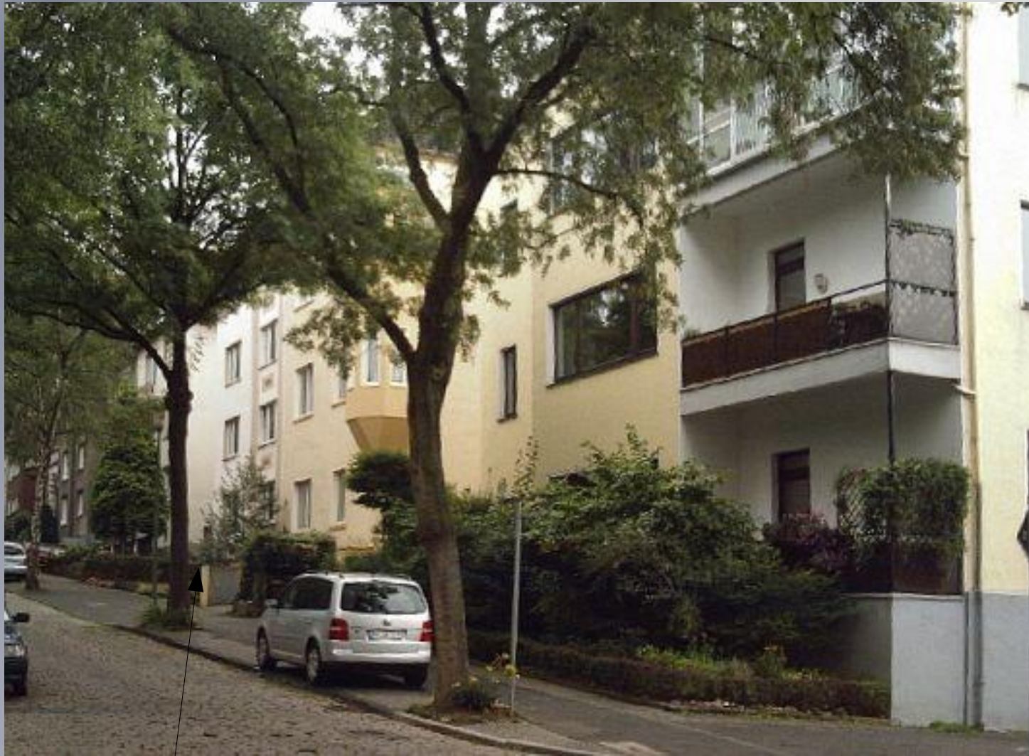
Haus Nr. 63